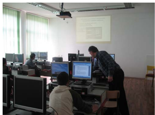
НОВ, САВРЕМЕН КАБИНЕТ ЗА ИНФОРМАТИКУ