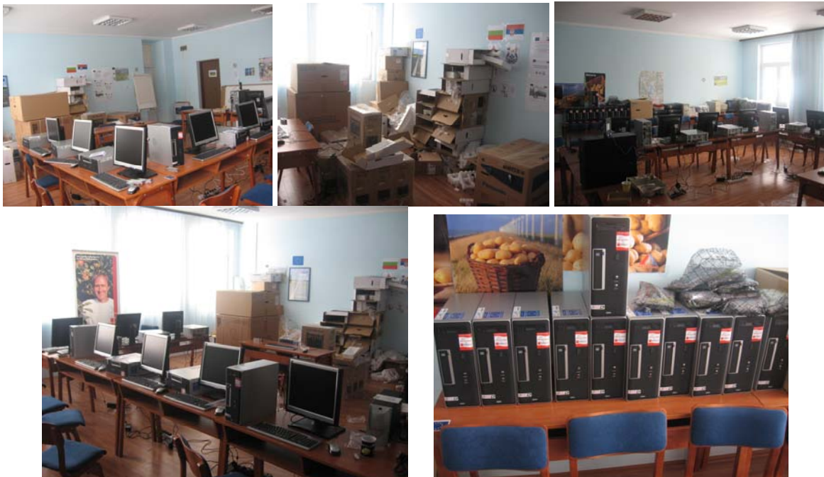
Монтажа рачунара и инсталација софтвера