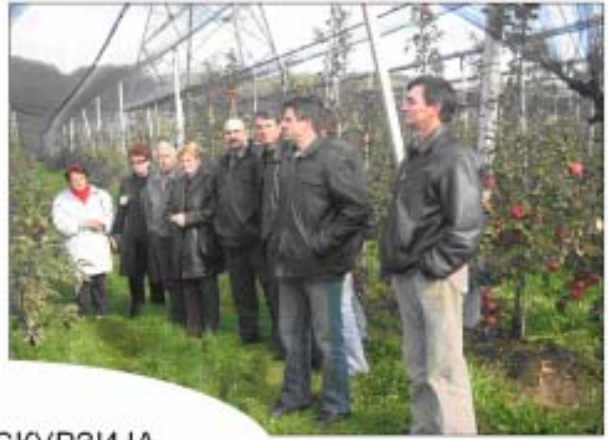
СТРУЧНА ЕКСКУРЗИЈА СЛОВЕНИЈА – ОПШТИНА КРШКО