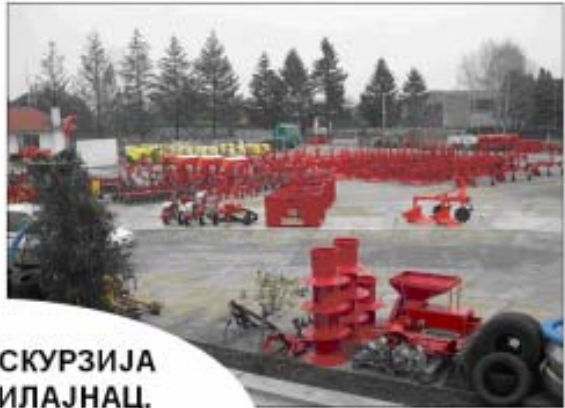
СТРУЧНА ЕКСКУРЗИЈА СРБИЈА: СВИЛАЈНАЦ, ВРШАЦ, ЗРЕЊАНИН, ДЕБЕЉАЧА, ЈАША ТОМИЋ...